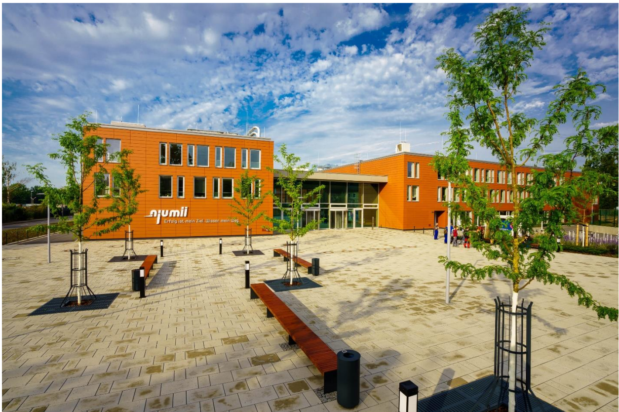
Foto: Außenansicht mit Haupteingang njumii – das Veranstaltungszentrum

Die hochmoderne Technik, die klare Architektur und die gute Infrastruktur machen njumii – Das Veranstaltungszentrum zum perfekten Ort für Ihr Event.